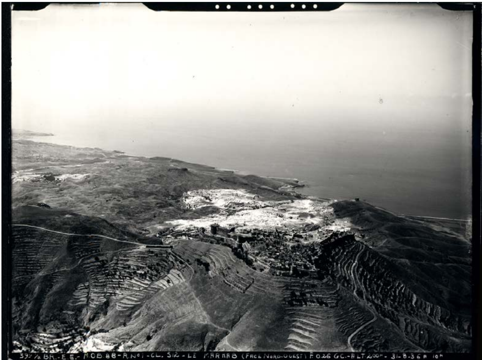
39 1/2 BR. - E. E. - M. O. B. 88 - R. N. 01 - CL. 512 - LE. MAR RAB (FACE Nord-Ouest) F. 0.26 GC. - FLT 200m - 31-8-36 R 10m