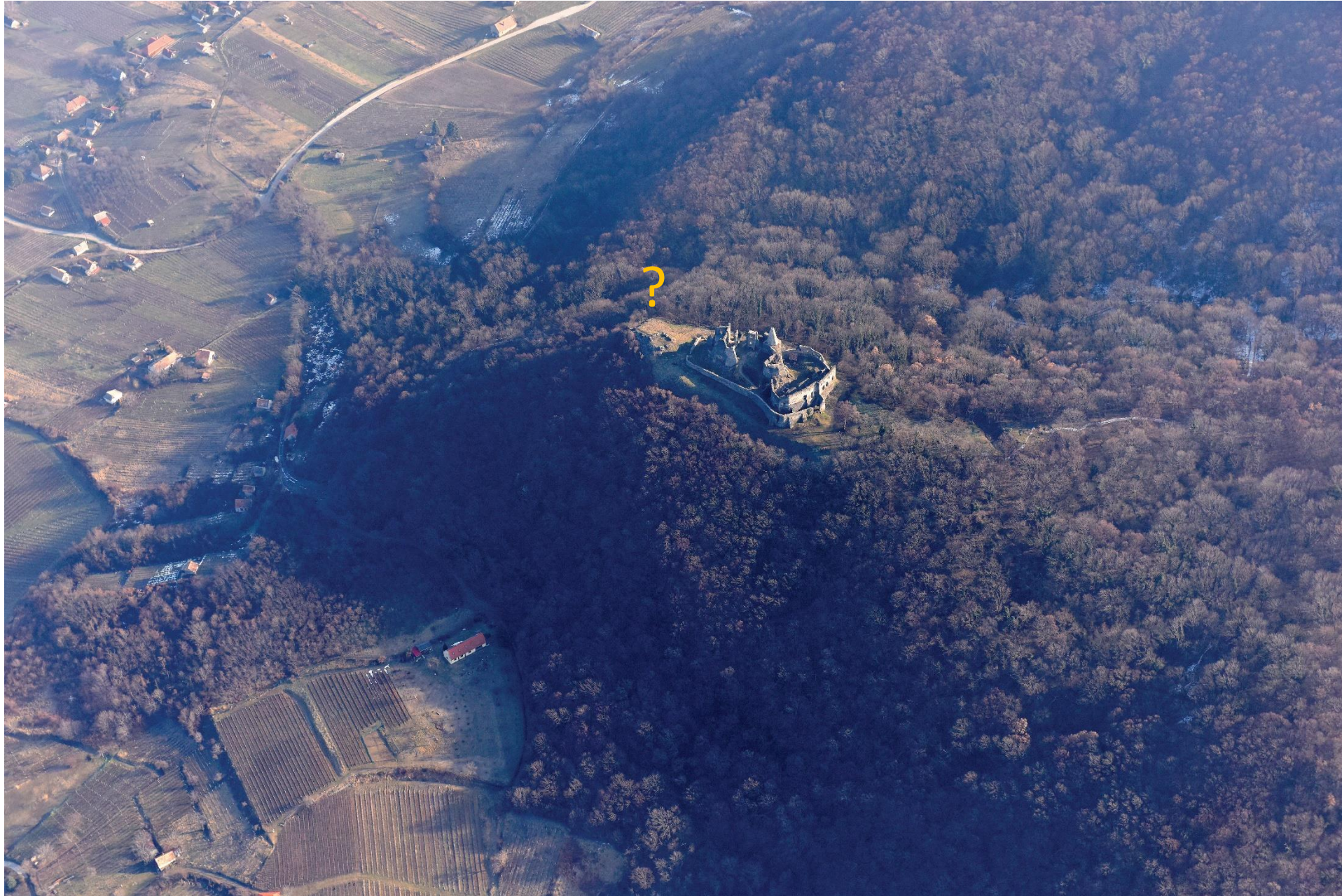
A Vár a Somló hegyen 2019. Januárban The Castle on the Somló Hill in January 2019.