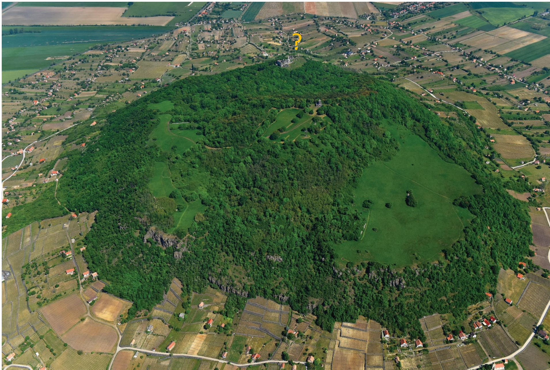
A Somló-hegy teteje, a Vár a kép felső részén, középen The Top of the Hill, the Castle is to be seen near the questionmark