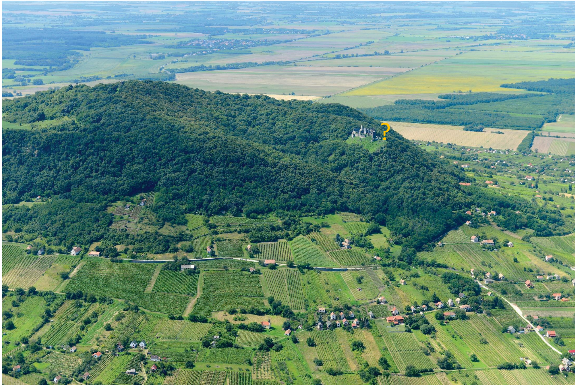
A Somló-hegy északi oldala The northern slope of the Hill