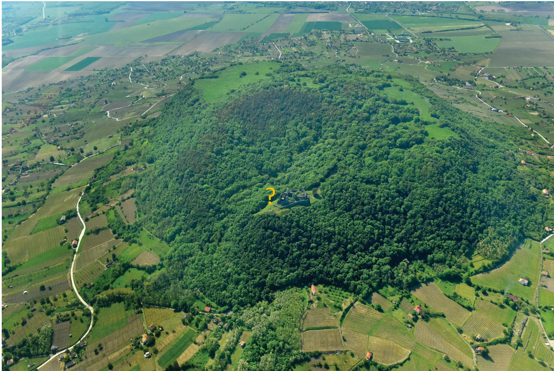
A Somló-hegy teteje, a Vár a kép középső részén The Top of the Hill, the Castle is to be seen near the questionmark