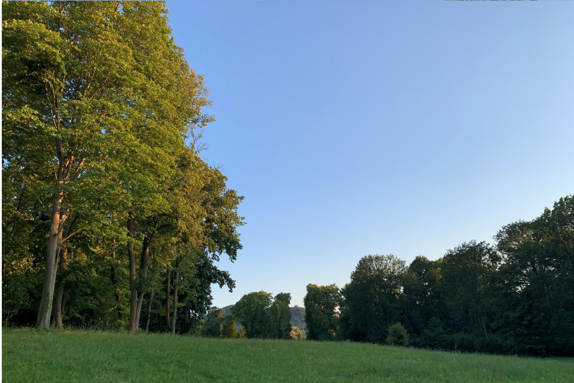
A dobai Erdődy kastélytól feltáruó Vár a park egyik nyiladékán át View of the Somló Castle through the cuts in the park vegetation from the terrace of the Castle as point of view