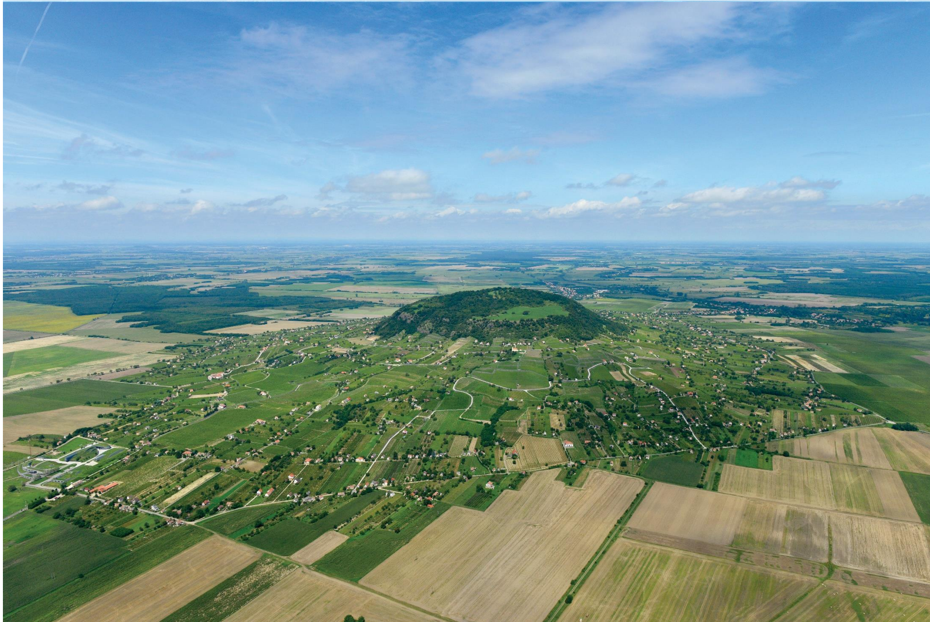
A Somló-hegy déli oldala The southern slope of the Somló Hill