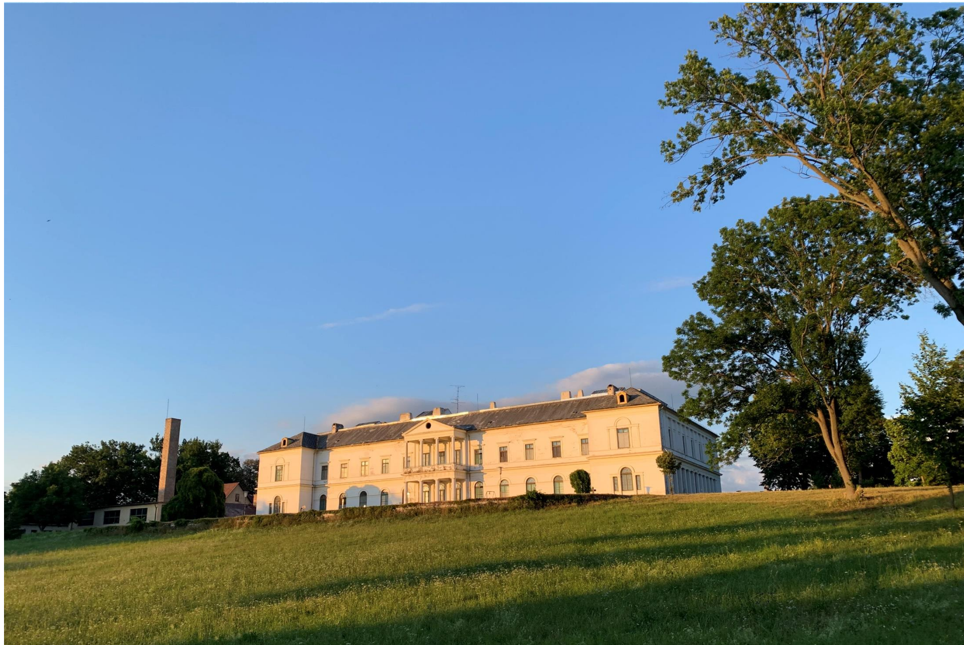
A dobai Erdődy kastély The Erdődy Castle in Doba