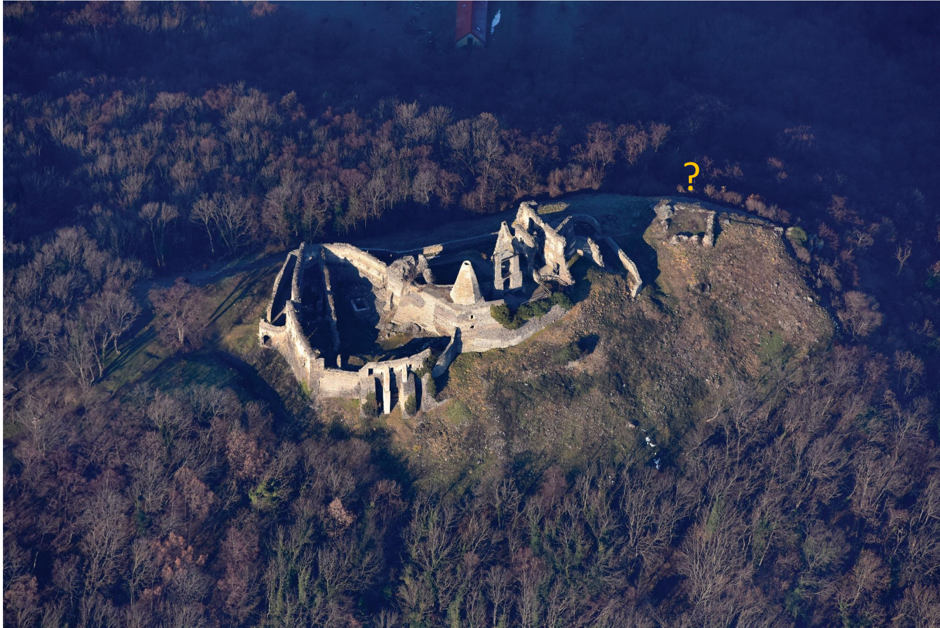
A Vár a Somló hegyen 2019. Januárban The Castle on the Somló Hill in January 2019.